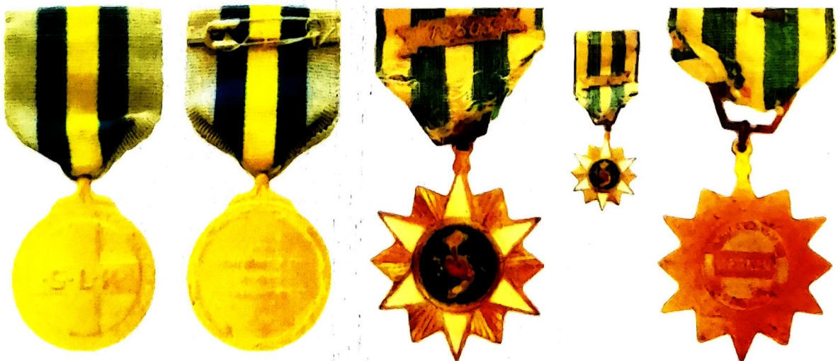
ตัวอย่าง เครื่องราชอิสริยาภรณ์

เครื่องราชอิสริยาภรณ์ในปัจจุบัน เป็นเครื่องหมายใช้ประดับเสื้อ เครื่องแบบพิธีการซึ่งนิยมกันทั่วไป ไม่เว้นแม้แต่ในประเทศที่ไม่มีพระมหากษัตริย์ทรงเป็นประมุข ก็ยังได้รับความนิยม โดยถือว่าเป็นสิ่งส่งเสริมเกียรติของบุคคลผู้มีผลงานดีเด่น ต่อส่วนรวมให้เป็นแบบอย่างที่ดีควรยึดถือ แต่มิใช่เป็นเครื่องหมายแบ่งแยกชนชั้น แต่อย่างใด